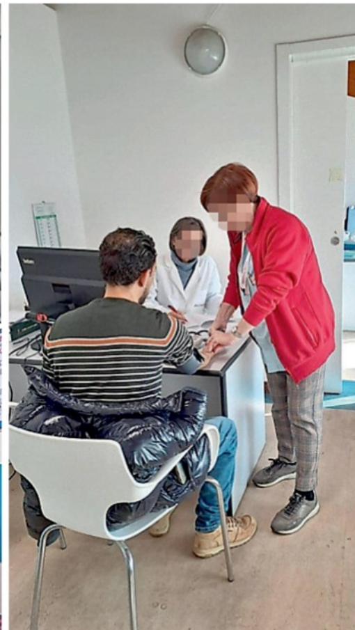
Alcune immagini degli ambulatori Salute senza confini della Caritas di Mestre e di Emergency a Marghera