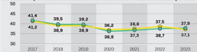
Età media del personale OSS al momento della dimissione inattesa per sesso