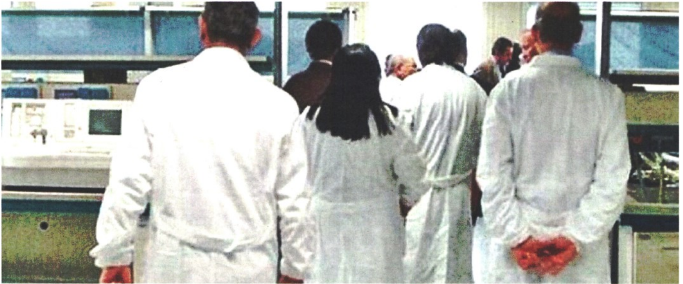
CAMICI BIANCHI È difficile la situazione degli organici medici anche negli ospedali del Veneziano