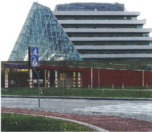
L'OSPEDALE PRINCIPALE L'esterno dell'Angelo di Mestre