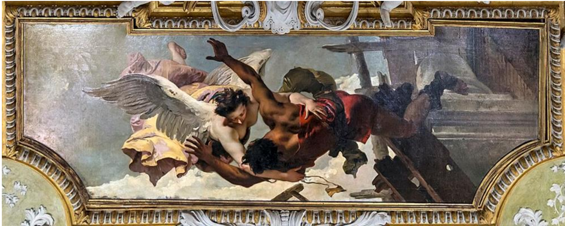
Muratore salvato da una caduta per intervento divino

La Scuola Grande dei Carmini è un palazzo di Venezia, ubicato nel sestiere di Dorsoduro, nella Calle della Scuola che collega il Campo Santa Margherita ed il Campo dei Carmini. È la sede dell'omonima scuola di devozione e di carità, più precisamente Scuola Grande Arciconfraternita di Santa Maria del Carmelo .