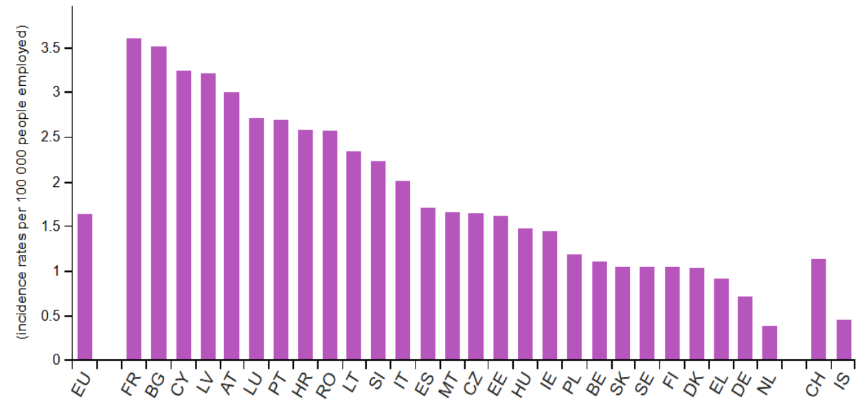
Fatal accidents at work, 2023